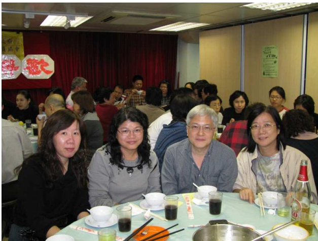
會員與家屬共聚一堂 (攝於蛇宴聯歡)

福利：勞聯蛇宴的師傅技藝超群，所以每年的捧場客特別多。本會分別於11月21及24日舉辦的「蛇宴聯歡」，都座無虛席。