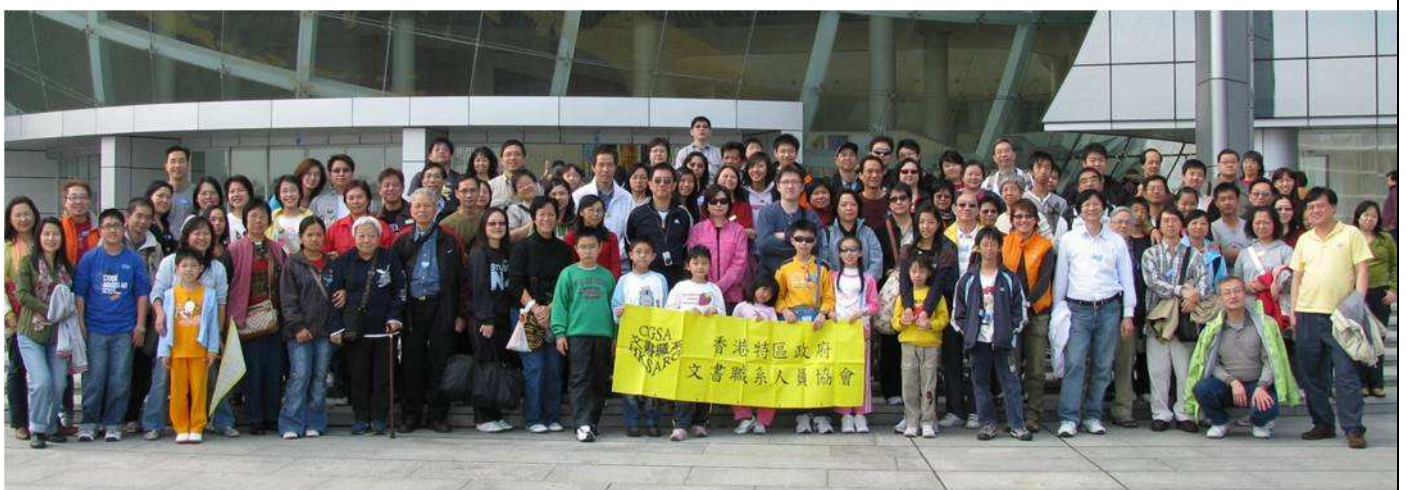
會員與家屬在廣東科學中心來個大合照留念 (攝於聖誕溫泉三天團)

旅遊：期間舉辦了「逢簡水鄉二天團」、「金水台溫泉三天團」及「南昆山溫泉三天團」等活動。