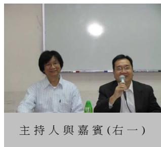
主持人與嘉賓(右一)

座談會上，梁先生指出，有鑑於文書職系人員有嚴重老化的情況出現，加上文書主任職系出現空缺，政府決定重新公開招聘助理文書主任。是次招聘，共接獲約 25,000 份申請，預計首批獲聘的新同事，會於本年中到任。同時，處方目前並沒有確實計劃公開招聘文書助理。如果要舉行公開招聘，相信最快也要於 2010 年才會進行。由於現時的中學學制，將會改為三年初中、三年高中，因此處方已開始研究在新學制下文書職系的入職資歷要求，以及薪酬的釐定。