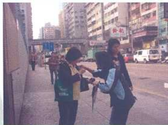
攝於「賣旗籌款活動」

服務：本會近20名義工參加循道衛理觀塘社區服務處舉辦的「賣旗籌款活動」，為長者及弱勢社群籌募經費。