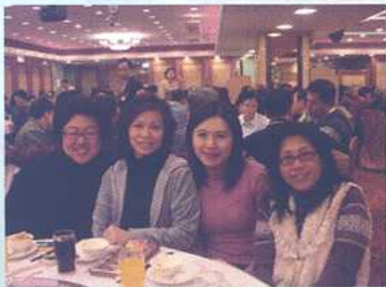
本會部份代表攝於勞聯團年飯

聯絡：執行委員會代表出席了勞工社團聯會（勞聯）於1月31日舉行的「團年飯」，與勞聯各成員會代表聚首一堂。